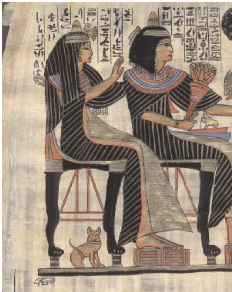
Den klassiska väggmålningen från Ipuy's grav (1200-talet f.Kr).

Vad som är arv och miljö i en katts beteende tvistar de lärde om, men ju mer man forskar kring ämnet, desto klarare kommer vi kunna tolka vad som är vad. Vissa beteende är dock givna att de finns i generna (arvet), det är överlevnadsfunktionerna och fortplantningsfunktionen. Kattens jaktbeteende anses vara både nedärvt och inlärt. Mycket lär sig en kattunge av kattmamman. En katt som inte får umgås med artfränder som kattunge blir aldrig en katt. Det blir med andra ord en