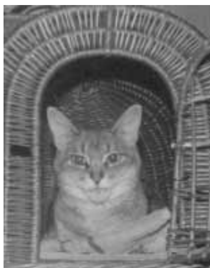
Odessa av Silverbäcken, ”Lione”, född 1972. Farfarsfarmor var IC Nigella Constatine